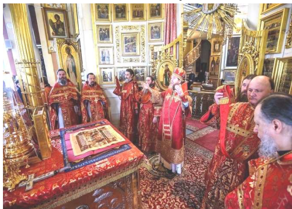
В алтаре Михайловского собора Псково-Печерского монастыря. Фото 2020 г.

Первый храм построил пророк Моисей для укрепления веры своего народа во время 40-летнего странствования по пустыне. Это строение представляло собой шатёр и называлось скинией.