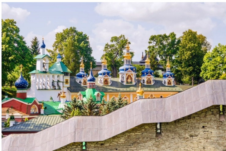
Псково-Печерский монастырь. Вид на Успенский храм и звонницу.

Князь Владимир выбрал православное христианство для Руси не случайно, ведь ему многое понравилось в культуре Византии, которая уже долгое время была православной страной. Понравилось богослужение, глубоким показалось учение Христа, приглянулась церковная архитектура. Поэтому храмы, строящиеся на Руси, возводились по византийской традиции.