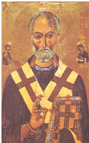
Николай Чудотворец. Икона XIII в.

Православный календарь. Месяц декабря: 19 (19) – иже во стѣхъ о҃тца нашего николаа, архїепископа мѣрлѣкїйскихъ чудотворца