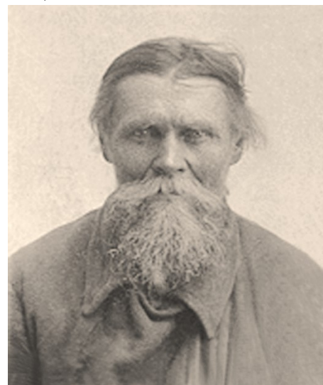
Крестьянин Иоанн Чернов. Пытался возобновить службы в храме в 1937 г. Арестован и умер от голода. Прославлен в лике новомучеников в 2000 г.