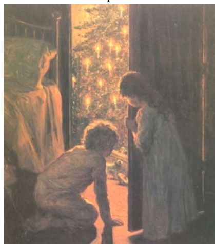
Генри Мослер. Рождественское утро. 1916 г.

Дедушка бывал очень весел и доволен за свою босоногую команду. Он сам превращался в ребёнка: пел, шутил, возился, играл свой марш... Каким светлым лучом бывал этот праздник в сереньком домике для ребят горькой бедноты, которые попадали на эту ёлку. Она им снилась целый год и блестела еще ярче, чем та рождественская звезда, которую клеил им дедушка и с которой они славили Христа.