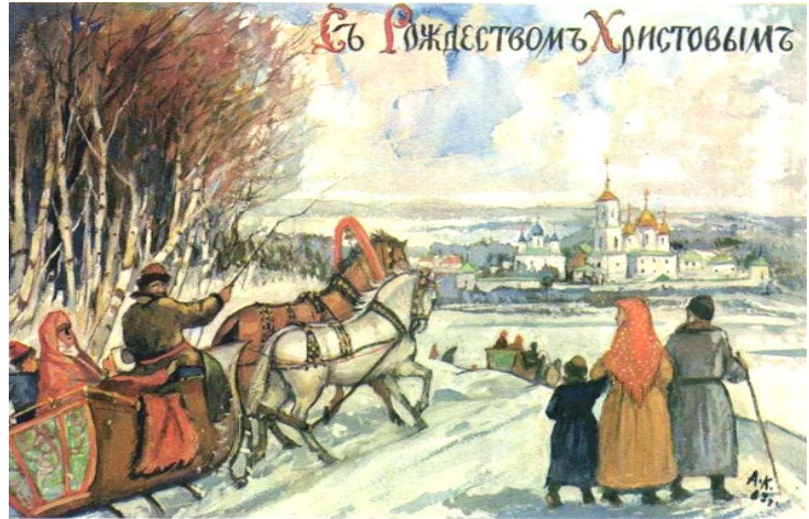
Рождественская дореволюционная открытка

А тут ещё является она — зеленая стройная ёлочка, с которой сохранилось столько легенд и воспоминаний... Привет тебе, милая любимая ёлочка!.. Ты несешь нам среди зимы смолистый запах лесов и, залитая огоньками, радуешь детские взоры. У нас в семье был обычай к большим праздникам делать друг другу подарки, сюрпризы, неожиданно порадовать, повеселить... Все потихоньку готовили свои рукоделия, мы учили стихи; под Новый год и на Пасху под салфетки каждому клали приготовленные подарки... Нас, детей, это очень занимало и радовало. Подарки бывали простые, дешевые, но вызывали большой восторг.