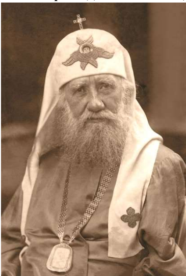
Тихон (Белавин), патриарх Московский и всея Руси с 1917 по 1925 гг. Причислен к лику святых в 1989 году.