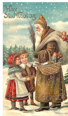
Рождественская открытка XIX века

Мы видим, что Николай действительно жил святой жизнью. Но не щедрость сделала его святым, а жизнь по заповедям Христовым. Наверное, поэтому его поставили архиепископом (первосвященником) города Мир Ликийские, потом прославили в лике святителей – святых епископов. Теперь его так и называют – святитель Николай, архиепископ Мир Ликийских чудотворец... И также как и он дарят подарки на Рождество.