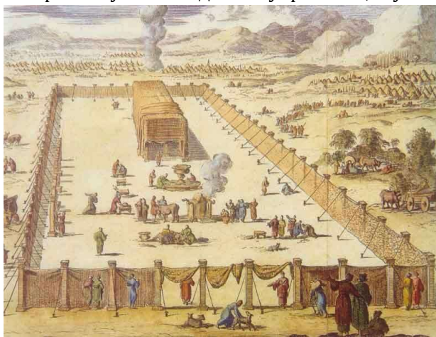
Скиния – похóдный храм в пустыне. В центре двора – Святилище и Святое святых. Рисунок.

Из золота сделали жéртвенник, стол для 12 хлебов, семисвёчник, украшенный херувимами ковчег заветá с помещёнными туда скрижа́лями, на которых были начертаны заповеди. Кстати, к ковчегу завета, в так называемое Святое святых – наиболее важную часть храма – мог заходить священник всего один раз в год. От остальной части храма Святое святых было отгорожено завёсой.